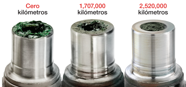
Los ejemplos de uso real de las juntas de cardán para alta kilometraje prácticamente no muestran desgaste.